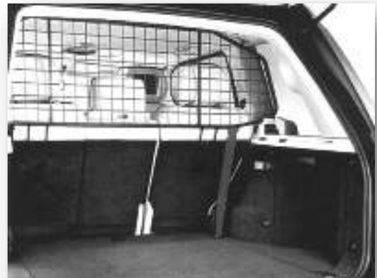
RANGE ROVER HONDENREK (2 van 2 modellen)