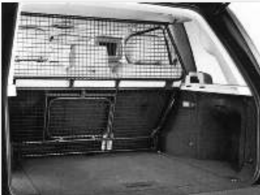
RANGE ROVER HONDENREK (1 van 2 modellen)