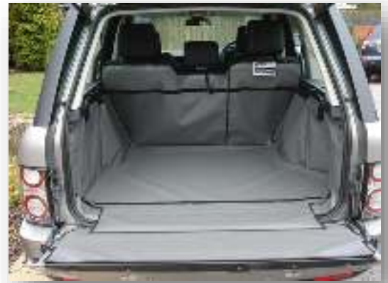
Achter Plus met gesplitste stoelen, Achterklepbescherming, en voorbereiding voor Bumper Flap en Stoel Flap