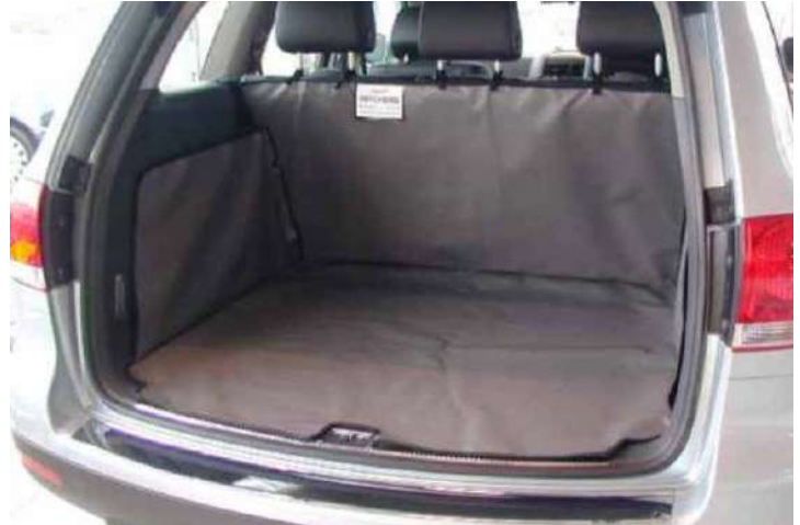
SH1-SUSPNO Achter Plus kofferbakbescherming