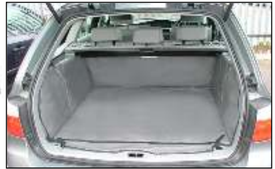
Standaard kofferbakbescherming voorbereid voor een bumper flap