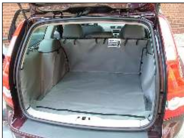
Achter Plus kofferbakbescherming voorbereid voor een Bumper Flap