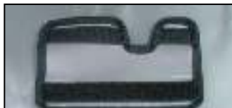
PVC: klittenband tabblad