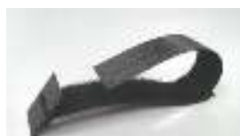
Ref: 099 tabblad