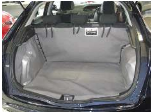
Achter Plus Kofferbakbescherming