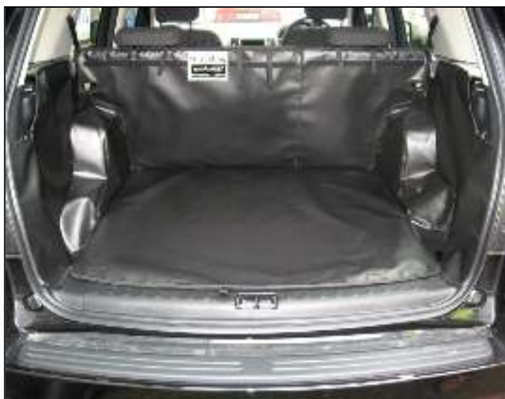
Achter Plus versie met voorbereiding voor een Stoel Flap