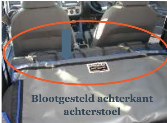
Blootgesteld achterkant achterstoel