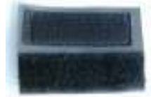
haak/lus klittenband tabs