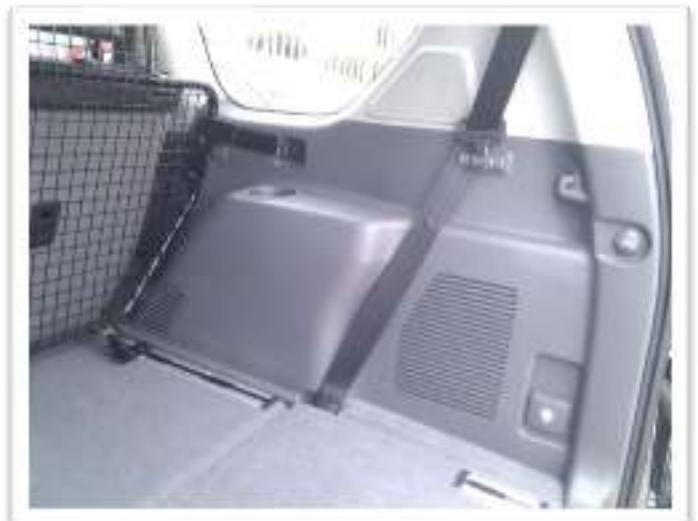
LUCHTOPENING AAN PASSAGIERSKANT