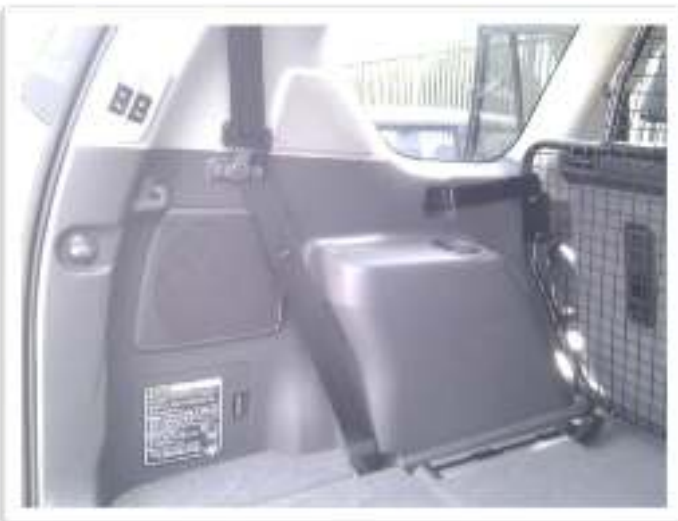
UITSPARING AAN BESTUURDESKANT