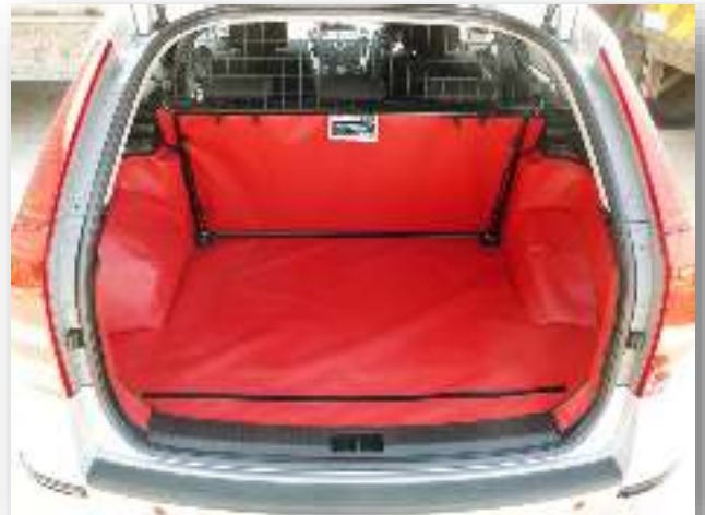
Hondenrek versie – voorbereid voor een Bumper Flap