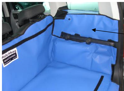
Stang met haken compleet met ruitstijlflappen