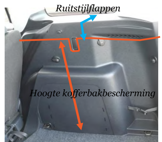
GEEN stang met haken

OPMERKING: Verwijder de afdekking van de kofferbak van het voertuig wanneer de ruitstijlflappen worden gebruikt.