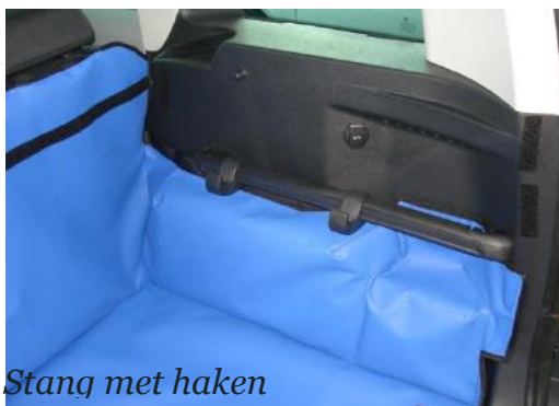
Stang met haken