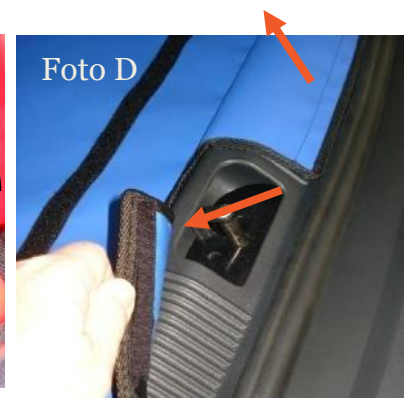
KUNSTSTOF STRIP OP DREMPEL