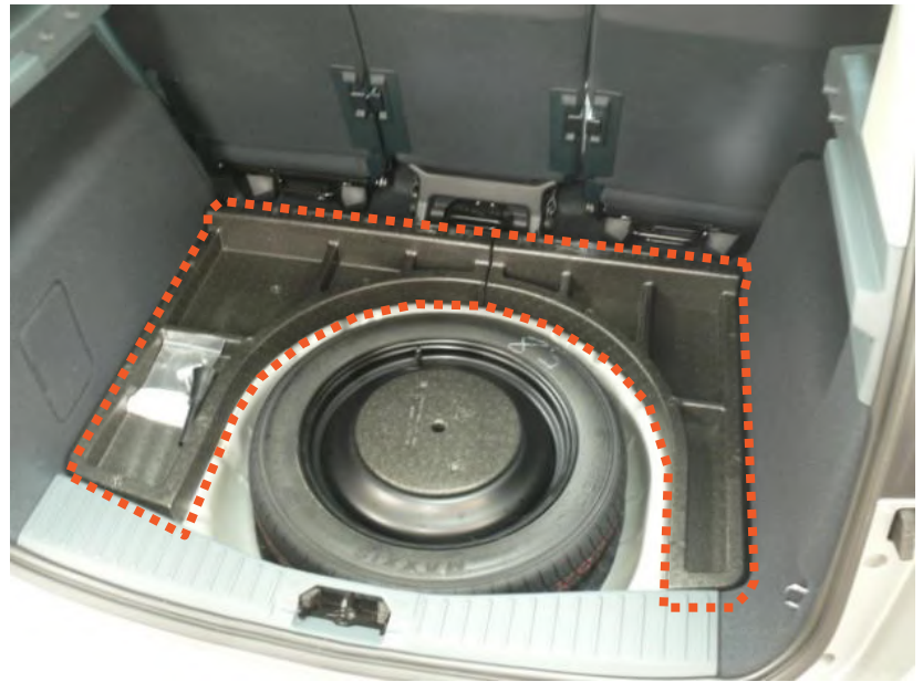
Ruimtebesparend reservewiel + GROOT schuimbak