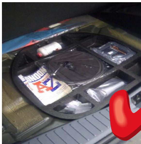
GEEN reservewiel + KLEIN schuimcompartiment