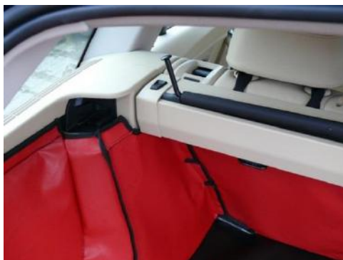
Net + afdekking van de kofferbak, vervangen