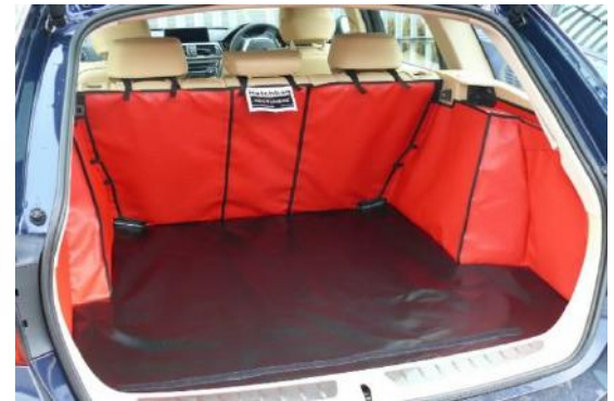
Op de foto: 'Achter Plus met gesplitste stoel, voorbereid voor de bumperflap'