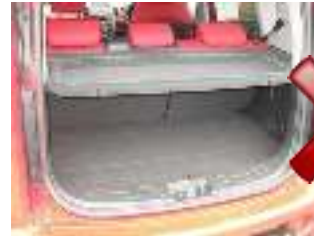
NIET geschikt voor valse vloer

De Kofferbakbescherming is niet geschikt voor de valse vloer of opslagbakken