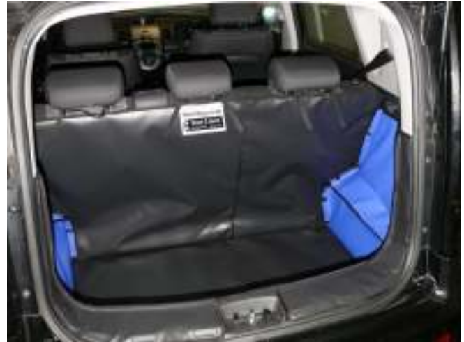
Achter Plus met gesplitste stoelen (Aangepaste Kleur)