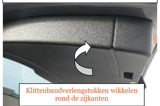
Klittenbandverlengstukken wikkelen rond de zijkanten