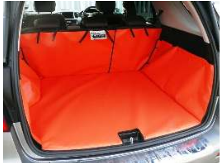
Achter Plus met gesplitste stoelen