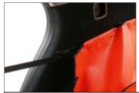
Foto C (Foto laat Achter Plus optie zien)