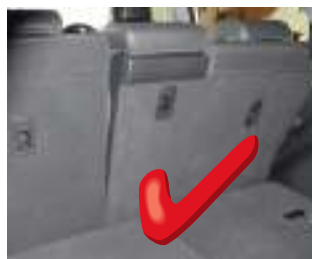
2e rij stoelen bijna rechtop

De Kofferbakbescherming zal NIET goed passen als uw stoelen niet in de juiste positie zijn