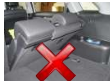
2e rij stoelen achterover