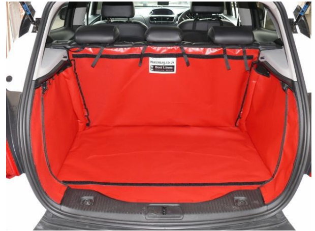
Achter Plus versie voorbereid voor Stoel Flap en Bumperflap