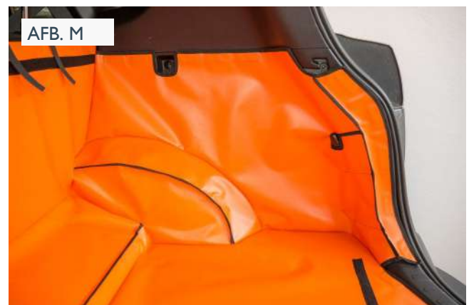
Hybride Standaard kofferbakbescherming voorbereid voor een Stoel Flap en Bumper Flap

bevestigde klittenbandbevestigingen. (Afbeelding J, K, L + M)