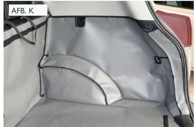
Niet-hybride Achter Plus voorbereid voor een Stoel Flap en Bumper Flap