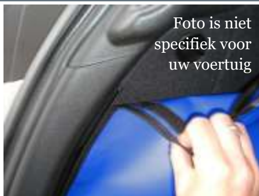
Foto is niet specifiek voor uw voertuig