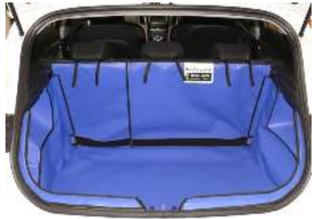
Achter Plus met gesplitste stoelen, voorbereid voor Bodemverlenging