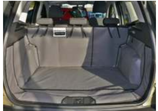
Valse bodem op de middelste stand