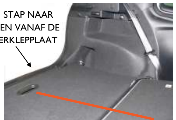
Wanneer de achterstoelen zijn neergeklapt, zit de kofferbak vloer gelijk met de stoelen

GEEN STAP NAAR BENEDEN VANAF DE ACHTERKLEPPLAAT