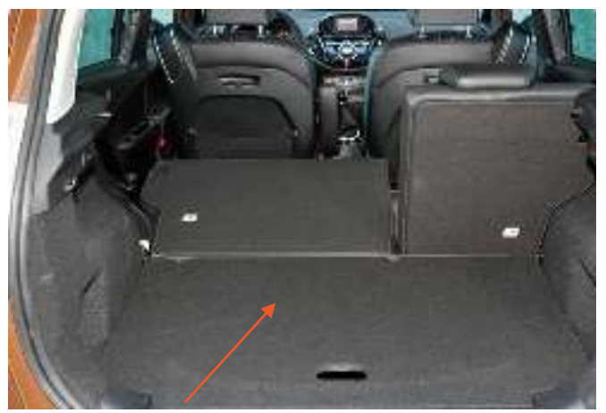
Valse vloer verhoogd tot het hoogste niveau