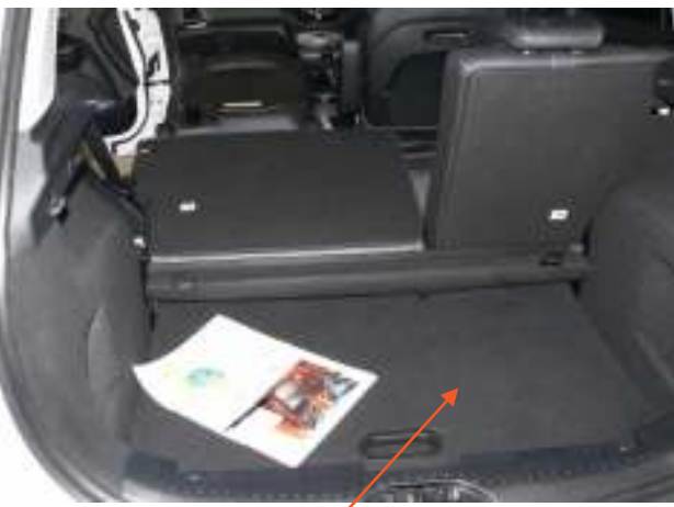
Valse vloer in de kofferbak op het laagste niveau