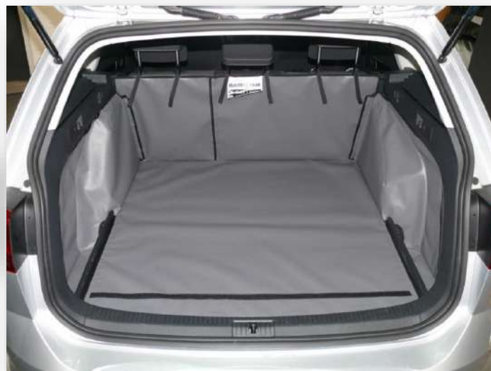
Foto: Achter Plus met gesplitste stoel, voorbereid op de extra bumperflap