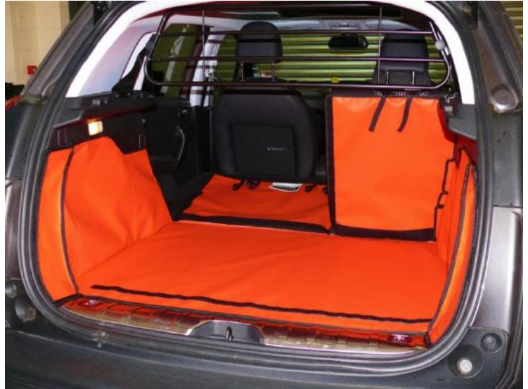
Foto: Achter Plus met gesplitste stoelen voorbereid voor Bumperflap en Bodemverlenging

Minimum van 16 zelfklevende lusvormige klittenbandbevestigingen