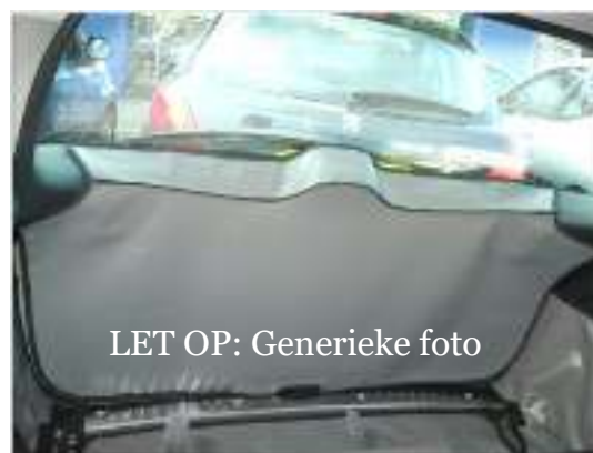
LET OP: Generieke foto

LET OP: Er is een klein, apart deel van de afdekking dat aan de achterklep is bevestigd. Terwijl de Hatchbag Achterklepbescherming in gebruik is, kunt u de afdekking niet weer aanbrengen.