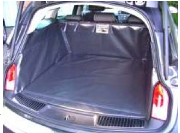
Hoge zijkant versie