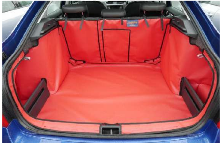
Achter Plus met gesplitste stoelen met twee opslagruimtes en een skiflap