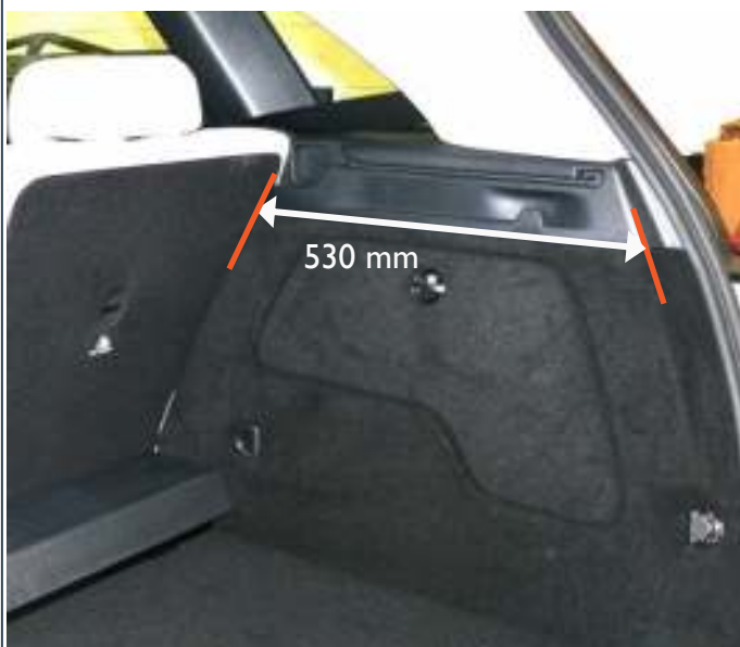
Meting om de positie van de achterstoelen te controleren