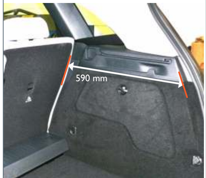
Meting om de positie van de achterstoelen te controleren