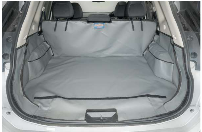
FOTO HIERBOVEN - VORM 2 MET VERLAAGDE VLOER