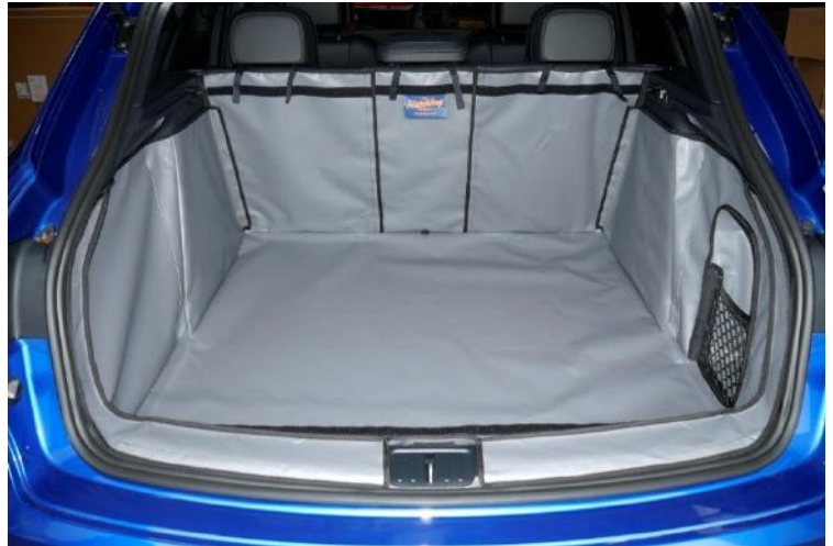
ACHTER PLUS MET GESPLITSTE STOELN