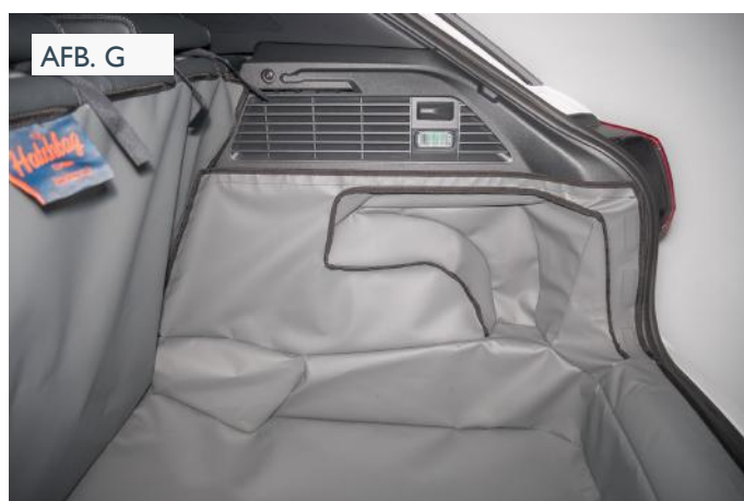
VERLAAGDE VLOER - PASSAGIERSKANT