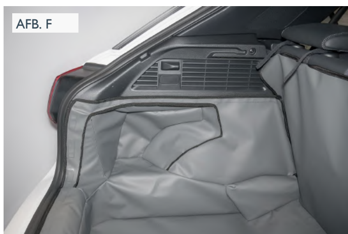
VERLAAGDE VLOER - BESTUURDERSKANT