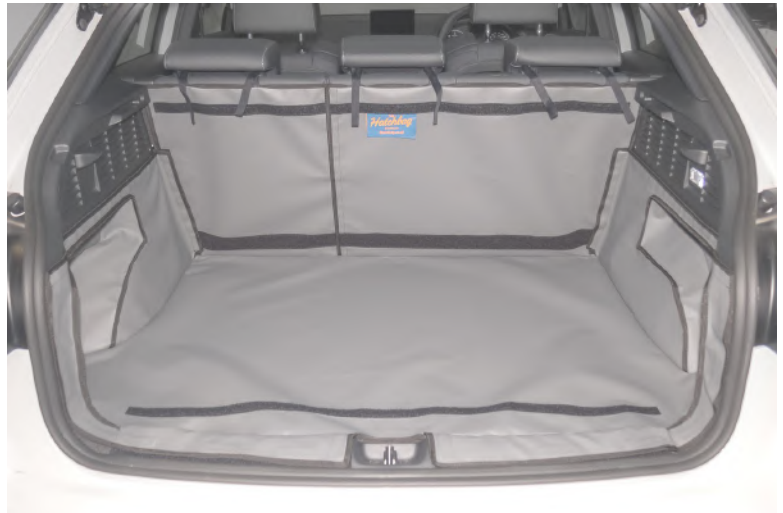
Verhoogde kofferbakbescherming met bumperflap, stoel flap en vloerverlenging voorbereiding