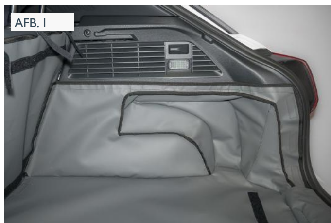
VERHOOGDE VLOER - PASSAGIERSKANT