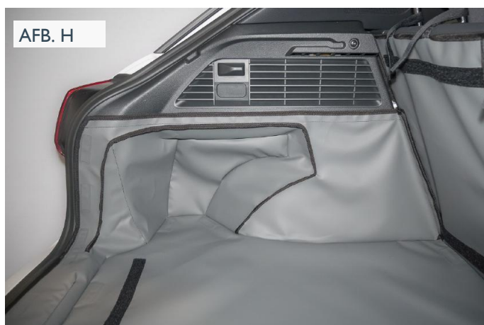
VERHOOGDE VLOER - BESTUURDERSKANT