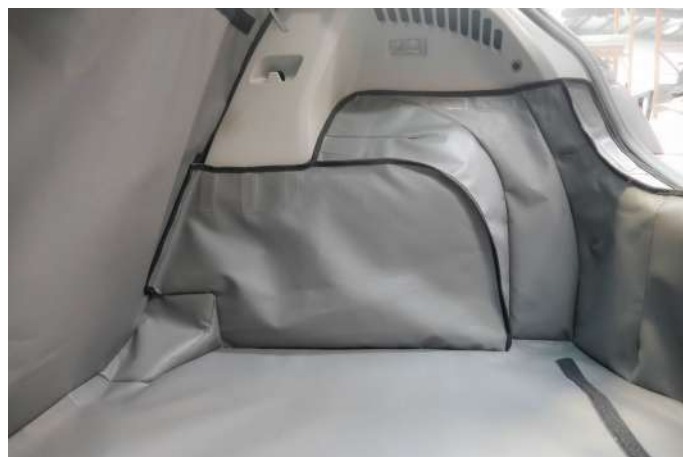
Kofferbakbescherming - passagierskant