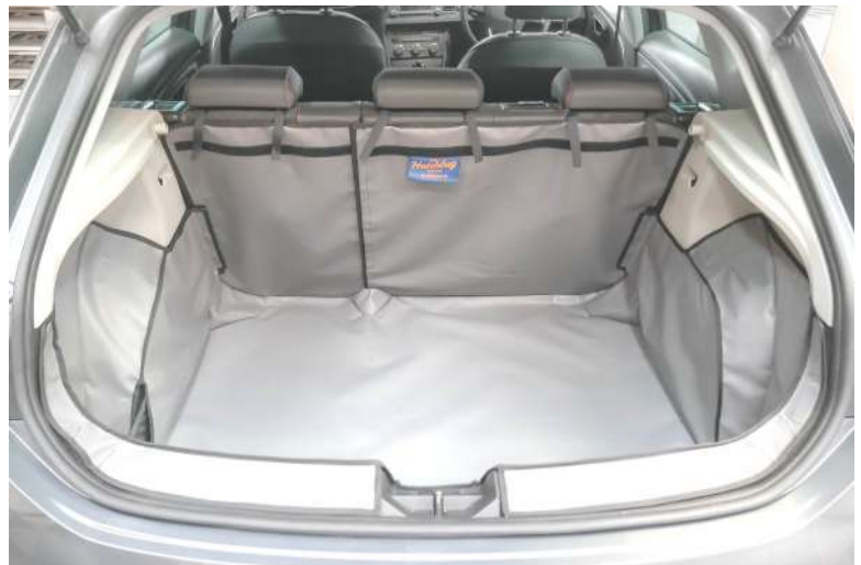
Achter Plus met gesplitste stoelen voorbereid voor Stoel Flap