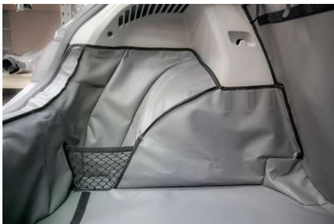
Kofferbakbescherming - bestuurderskant