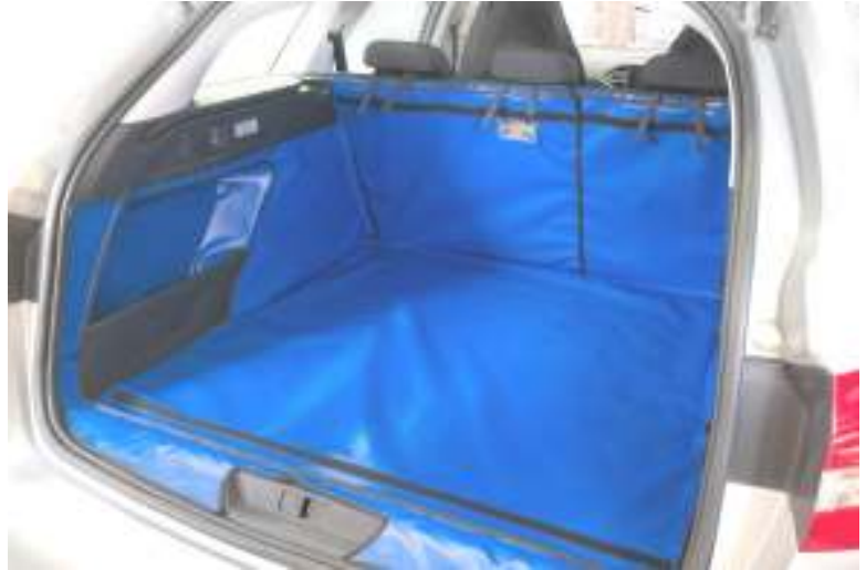
Gesplitste kofferbakbescherming met stoelflap en bumperflap - voorbereiding