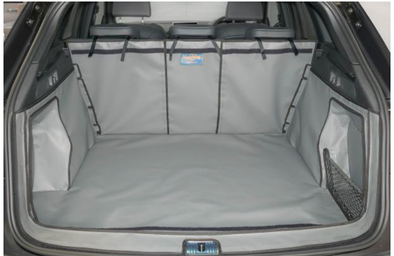
Foto laat kofferbakbescherming met gesplitste stoelen zien voor Vorm I