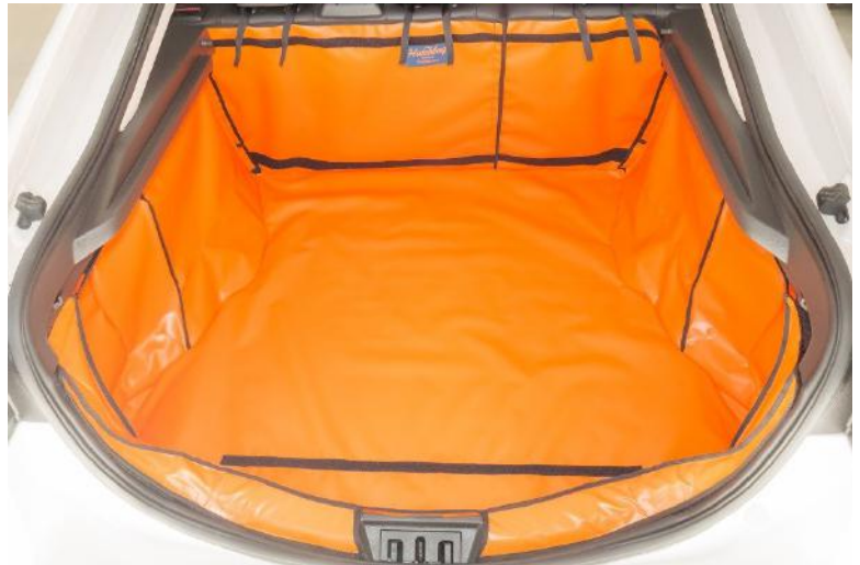
Achter Plus met gesplitste stoelen, voorbereid voor de bumperflap, stoel flap en bodemverlenging