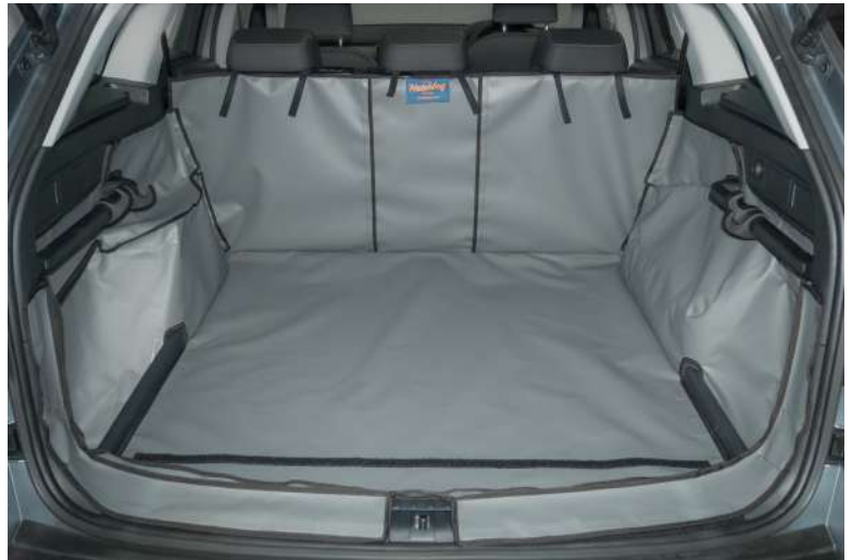
Gesplitste kofferbakbescherming met bumperflap - voorbereiding