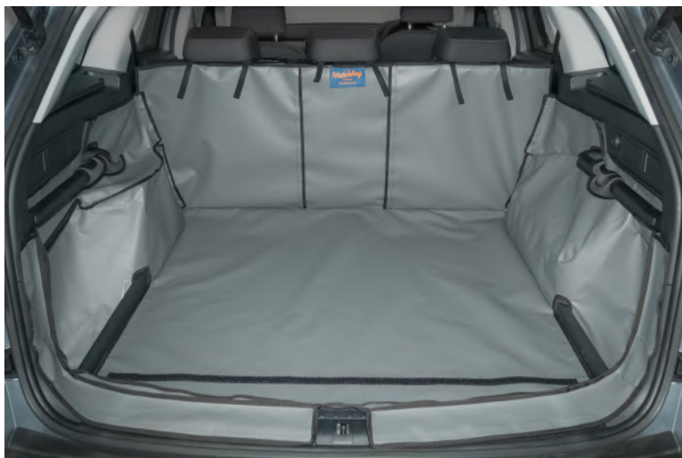
Gesplitste kofferbakbescherming met bumperflap - voorbereiding