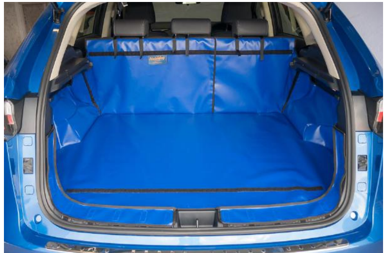
Achter Plus met gesplitste stoelen voorbereid voor bumperflap en stoel flap