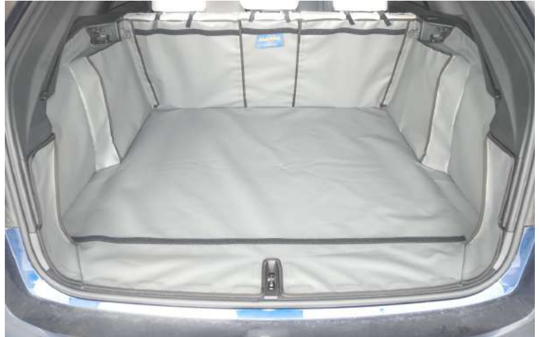
Vorbereiding kofferbakbescherming voor gesplitste achterstoelen, bumperflap en stoelflap