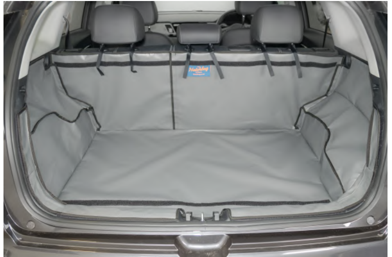
Vorm 2 + Geen luidspreker aan bestuurderskant - Acter Plus met gesplitste stoelen voorbereid voor Bumperflap en Stoel Flap