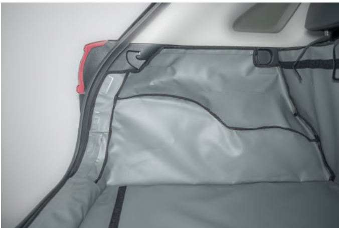
BESTUURDERSKANT - MET LUIDSPREKER