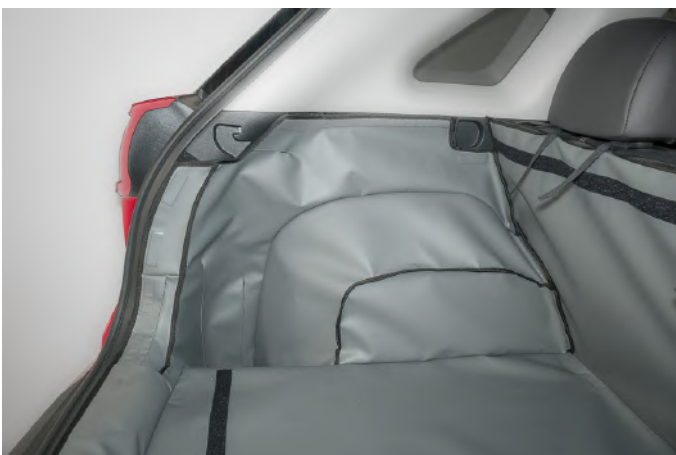
BESTUURDERSKANT - ZONDER LUIDSPREKER