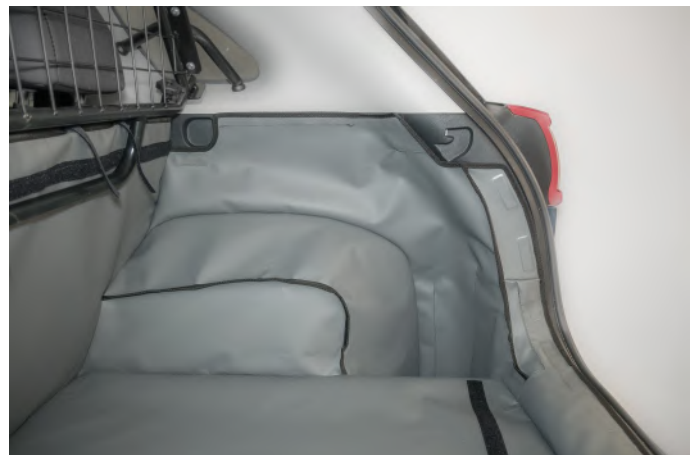
PASSAGIERSKANT - VORM 1 - ZONDER BATTERIJ