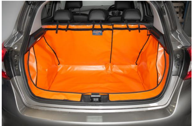
Achter Plus met gesplitste stoelen voorbereid voor Stoel Flap