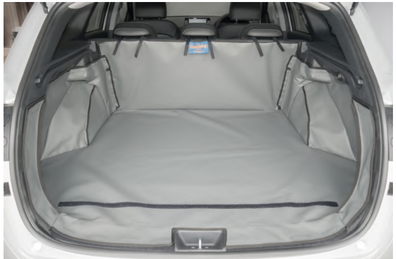
Achter Plus voorbereid voor Bumperflap