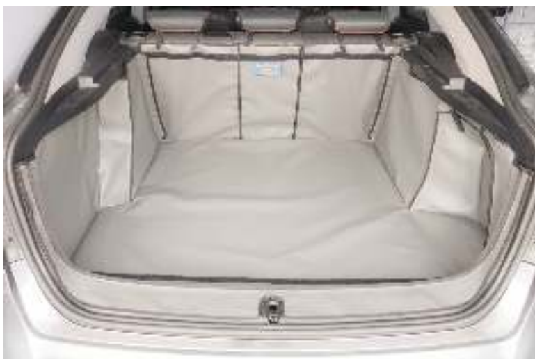
Kofferbakbescherming voorbereid voor gesplitste achterstoelen en bumperflap