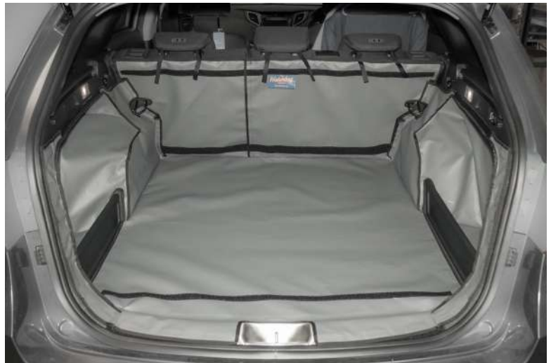
Achter Plus met gesplitste stoelen, voorbereid voor Bumperflap, Stoel Flap en Bodemverlenging