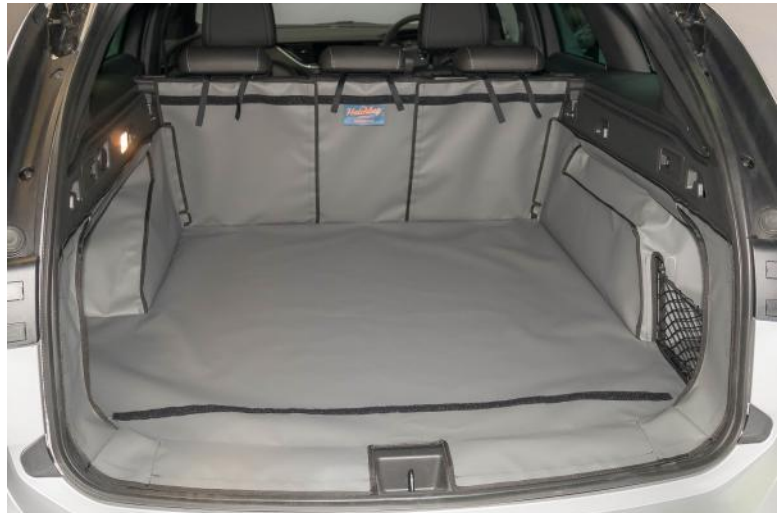
Achter Plus met gesplitste stoelen voorbereid voor Stoel Flap en Bumperflap