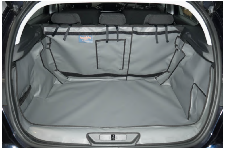
Achter Plus met gesplitste stoelen, voorbereid voor Ski-flap, Bumper flap, Stoel Flap en Bodemverlenging