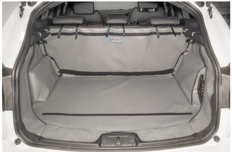
Achter Plus voorbereid voor Bumperflap, Stoel Flap en Bodemverlenging