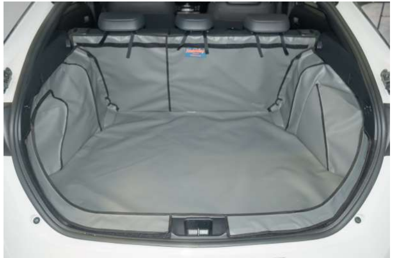
Achter Plus met gesplitste stoelen voorbereid voor Stoel Flap