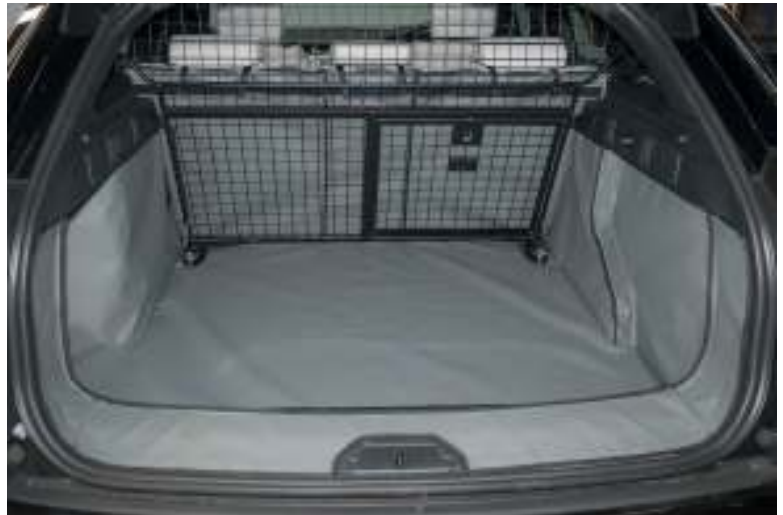
Model voor auto zonder net en met autohondenrek - optie Achterstoelen gesplitst