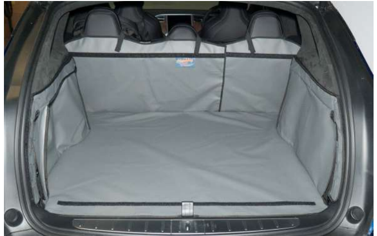
Achter Plus met gesplitste stoelen, voorbereid voor Stoel Flap en Bumperflap