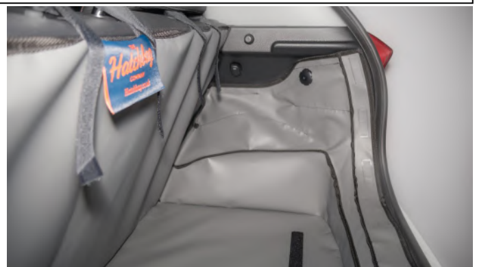
VERHOOGD VLOER - PASSAGIERSKANT