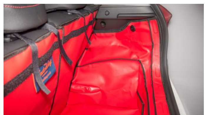
VALSE VLOER VERWIJDERD - PASSAGIERSKANT