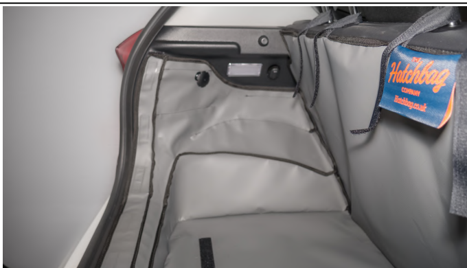
VERHOOGD VLOER - BESTUURDESKANT