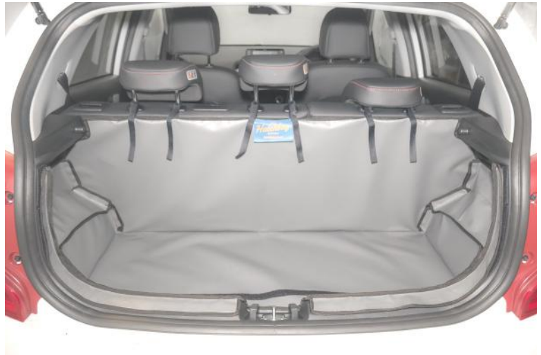
Verhoogde vloer versie met Achter Plus