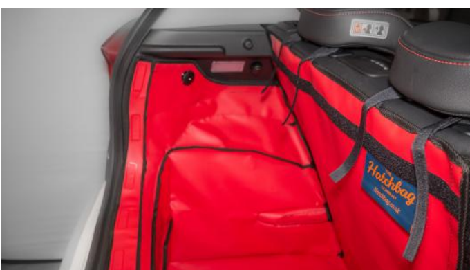
VALSE VLOER VERWIJDERD - BESTUURDESKANT