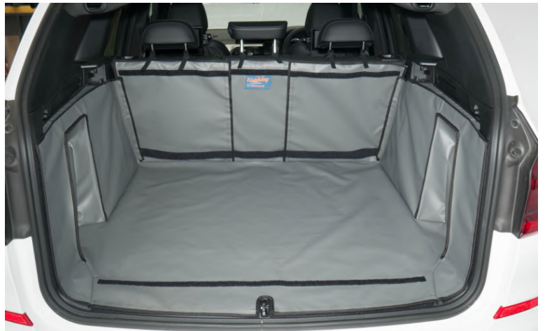
Achter Plus met gesplitste stoelen, voorbereid voor de bumperflap, stoel flap en bodemverlenging