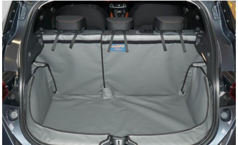
Achter Plus met gesplitste stoelen, voorbereid voor een Stoel Flap